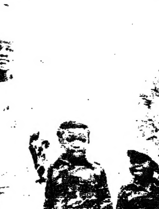
الرئيس امين والمجنونة سارة التي اصبحت زوجته امس الاول . ويبدو واداه بينهما

قام الجيش وسلاح الطيران الاوغنديان بصورة رمزية بمحو بقايا حكم الاقلية البيضاء بدك مدينة الكاب ووزانها تونجا . وكان هذا الهجوم انتحاري بقيادة الرئيس عيدي امين . وقد انفق الرئيس عيدي امين مبالغ كبيرة من المال في اعادة بناء مدينة الكاب ووزانها تونجا . وكان هذا الهجوم انتحاري بقيادة الرئيس عيدي امين .